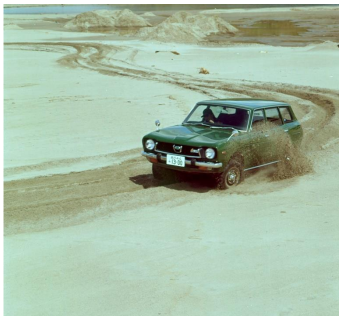
La Leone 4WD Estate Van

I modelli AWD attualmente rappresentano il 98%* 2 delle vendite globali di Subaru. Tutte le vetture con trazione integrale attualmente prodotte* 3 sono dotate del sistema Subaru Symmetrical AWD combinato con il motore "Boxer" a cilindri orizzontali contrapposti, altra tecnologia distintiva della casa giapponese.