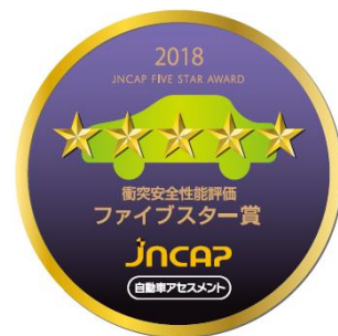
5 Stelle JNCAP