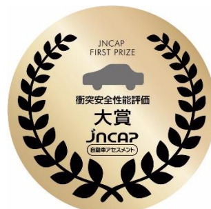
JNCAP Grand Prix Award